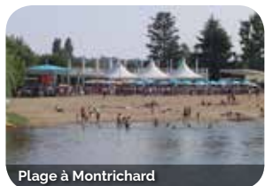
Plage à Montrichard