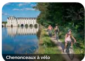
Chenonceaux à vélo