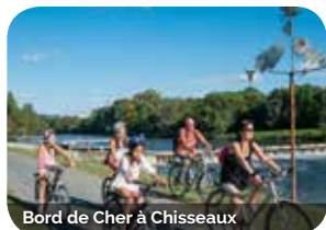
Bord de Cher à Chisseaux