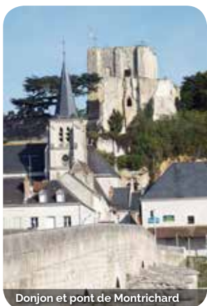
Donjon et pont de Montrichard