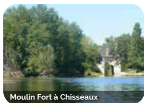
Moulin Fort à Chisseaux