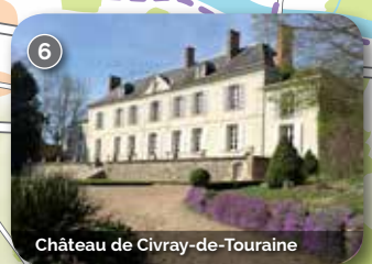
Château de Civray-de-Touraine