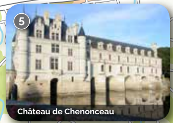
Château de Chenonceau