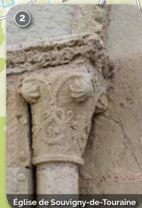
Église de Souvigny-de-Touraine