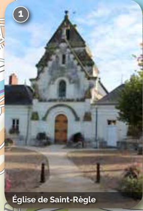
Église de Saint-Règle