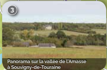
Panorama sur la vallée de l'Amasse à Souvigny-de-Touraine