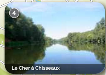
Le Cher à Chisseaux