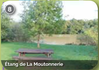
Étang de La Moutonnerie