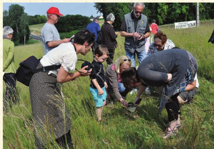
Sortie à la découverte des orchidées au printemps 2016.

Adhérente à la SEPANT (société d'études, de protection et d'aménagement de la nature en Touraine), et à France nature environnement en région Centre, qui met à disposition son fonds documentaire, Neva contribue enfin de manière très active à la diffusion de l'information environnementale, en organisant régulièrement des conférences-débats et des rencontres sur des thèmes diversifiés. ■