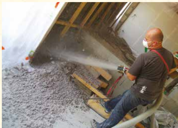
➔ Chantier d'isolation en ouate de cellulose projetée.

par les propriétaires lors de chantiers d'auto-réhabilitation encadrés par les Compagnons Bâtisseurs. Elle est réservée aux ménages dont les ressources ne dépassent pas les plafonds utilisés pour l'octroi d'un Prêt social location-accesion (PSLA), soit 41 232 € pour une famille de 4 personnes par exemple. ➔ L'aide sociale « pour un habitat économe en énergie » doit, quant à elle, contribuer à la lutte contre la précarité énergétique. Cette subvention, égale à 20 % du montant hors taxes des travaux dans un plafond de 1 500 €, est réservée aux travaux urgents et non éligibles aux aides financières de droit commun (Agence nationale de l'habitat, chèque énergie...), dont les équipements d'économie d'énergie. Elle s'adresse aux ménages dont les revenus ne dépassent pas les plafonds du Fonds de solidarité pour le logement (FSL) pour les aides au maintien des énergies, soit 811 € par mois (moyenne des ressources des 3 derniers mois) pour une personne seule. ■ Plus d'infos : rendez-vous sur www.cc-valdamboise.fr/habitat/habitat-logement/amelioration-de-lhabitat/