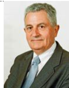
Le président, Claude Courgeau

C'est avec détermination, sens des responsabilités, volonté d'écouter et de rassembler que je m'impliquerai, avec l'ensemble des délégués communautaires, dans la conduite de ce beau territoire aux atouts incomparables, qui doit se montrer uni et solidaire, pour poursuivre son nécessaire développement dans un contexte national et international souvent rude et imprévisible.