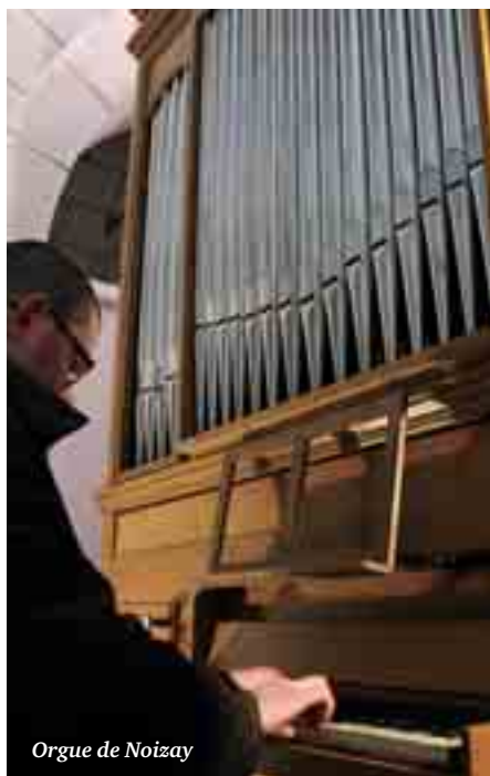
Orgue de Noizay