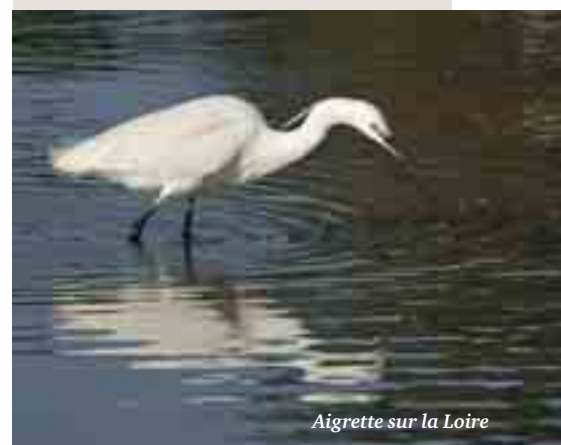
Aigrette sur la Loire