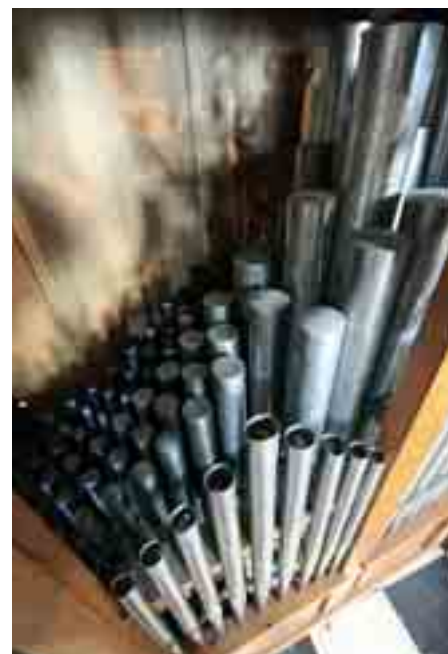
L'orgue de Notre Dame du Bout-des-Ponts

L'orgue de Notre Dame du Bout-des-Ponts est un orgue positif plutôt destiné à jouer de la musique Renaissance. Installé en Touraine dans les années 1975, il a passé quelques années en Anjou avant d'être acheté par la paroisse en 2000/2001. Nous ne disposons pas d'autres éléments concernant son histoire et son origine. ■