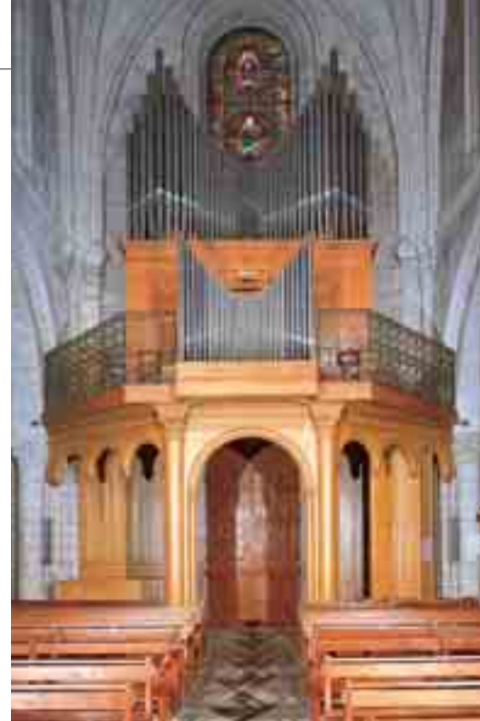
L'orgue de l'église St Denis