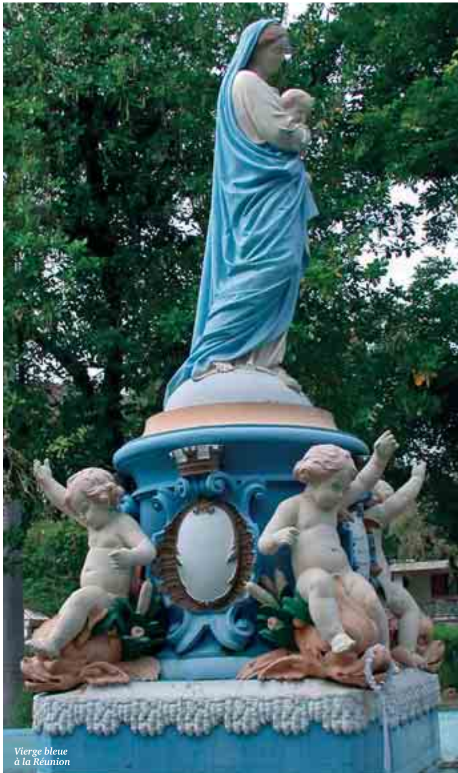
Vierge bleue à la Réunion