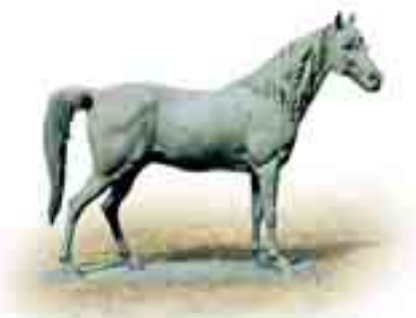
Cheval grandeur nature en Grande Bretagne

Voici comment le maître de forges parisien a fait évoluer une simple « usine à fer » en une fonderie d'art, pionnière dans les travaux artistiques en fonte de fer qu'elle essaïmera dans le monde !