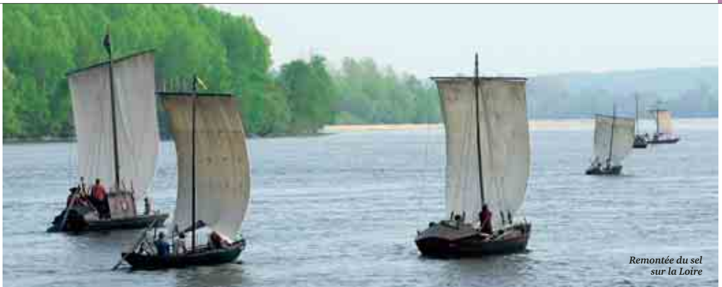
Remontée du sel sur la Loire