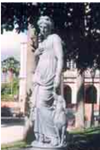
« La fidélité » à Recife

“ Une collection riche de plus de 12 000 pièces ”