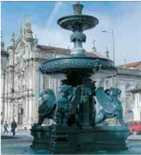
« Fontaine aux lions » à Porto