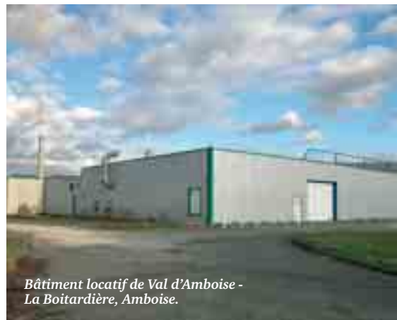
Bâtiment locatif de Val d'Amboise - La Boitardière, Amboise.

mental d'incendie et de secours (SDIS) un terrain de 15 000 m 2 pour l'implantation de la future caserne de sapeurs pompiers. ■