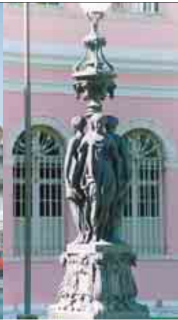
« Les trois grâces » à Recife (Brésil)

“ Les fontes naissent à Pocé, mais l’estampille « Paris » est indispensable à l’exportation ”