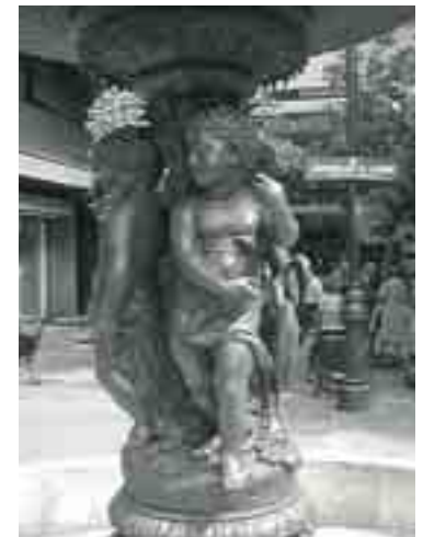
Détail d'une fontaine au Chili

JJ Ducel participe aux expositions nationales et internationales. Il obtient des mentions et remporte des médailles dès 1844. Le succès de ses œuvres est à la base de sa production à grande échelle, ce qui permet leur exportation vers les grandes villes du monde. Pour acquérir ces pièces, on peut s'adresser au siège parisien de la fonderie ou à des représentants qui disposent d'un catalogue illustré, mais les expositions sont la meilleure