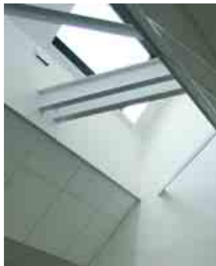
... et puits de lumière au nord pour l'éclairage des bureaux en journée.