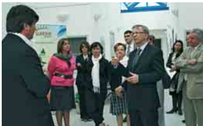
Dans les locaux d'Ainelec PHA, lors de la visite de François Bonneau, président du Conseil régional.

Il a convaincu le dirigeant d'une entreprise voisine, Yvelynox, qui va réaliser une extension de locaux de 2 000 m 2 et a investi dans 700 m 2 de panneaux photovoltaïques intégrés au futur bâtiment. L'investissement supplémentaire, de l'ordre de 500 000 €, pourrait être amorti sur dix ans grâce à la revente. ■