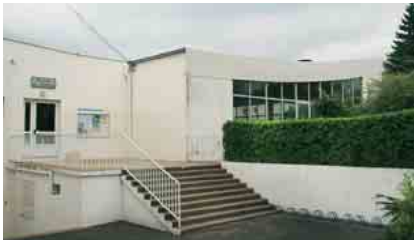
La Piscine Georges Vallerey

Val d'Amboise proposera au 1 er septembre à ses communes membres un service d'instruction des demandes d'autorisation d'urbanisme. Après Cangey, Nazelles-Négron, Neuillé le Lierre, Noizay, Pocé-sur-Cisse, Saint-Règle et Souvigny-de-Touraine, la commune de Chargé a signé une convention cadre avec la communauté de communes. Pour la ville d'Amboise, qui dispose de son propre service instructeur, une convention spécifique est proposée. Cette dernière sera soumise à l'approbation du conseil communautaire le 2 juillet prochain. ■