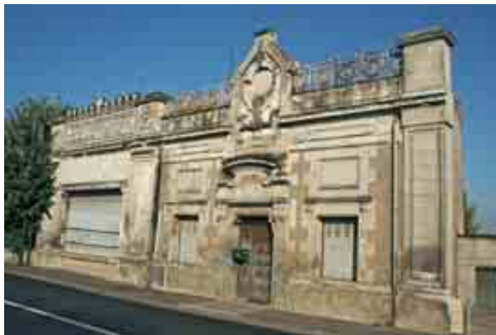
Les anciens bureaux Mabilbe

L'étude de faisabilité de l'aménagement de la fonderie Mabilbe a rendu ses conclusions ( lire en pages 12 et 13 ). D'un montant de 39 705 €, elle a été subventionnée à hauteur de 15 000 € au titre du « contrat de plan Etat - Région 2007 ». Le