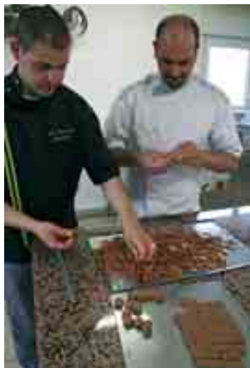
La Chocolaterie gourmande

La Chocolaterie gourmande , parc d'activités La Boitardière, à Amboise, va bénéficier d'une aide pour l'acquisition de matériel et d'outillage, d'une chambre froide négative, d'un four ventilé et la création d'un site internet de vente en ligne.