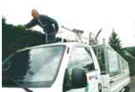
« Vert Vous »

La société d'entretien extérieur et espaces verts « Vert Vous », récemment créée à Amboise, se voit allouer une subvention pour l'achat d'une remorque sur mesure et de matériel (outillage spécifique, tondeuse, tronçonneuse, nettoyeur haute pression).