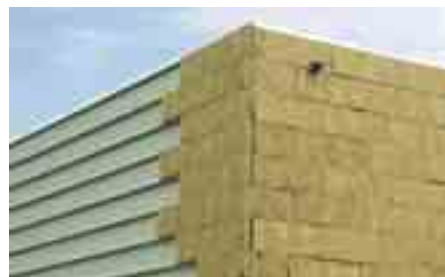
La laine de chanvre ou de bois gagne du terrain dans l'isolation des bâtiments industriels.

Les deux chantiers pourraient démarrer à l'automne... ■