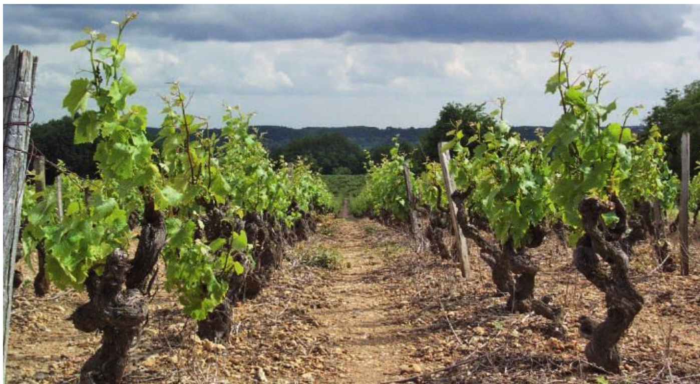
Un vignoble renommé dans les appellations Vouvray, Touraine Amboise et Touraine Chenonceau.

membres. Des questions se posent enfin sur les conséquences financières de ces regroupements, ainsi que leurs incidences sur les personnels des collectivités.”