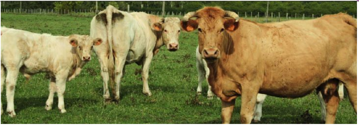
Charolaises dans les pâturages de la Grande Métairie.

Pour pouvoir commander, il faut adhérer à l'Amap, commander à l'avance pour une période donnée, venir chercher ses produits lors des distributions et participer à la vie de l'association.