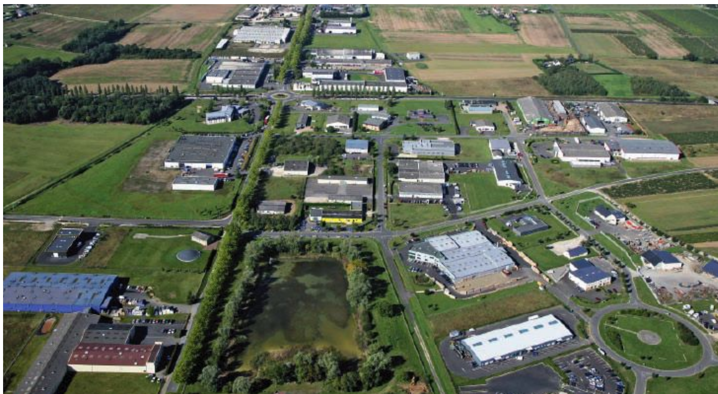
Une mise en œuvre plus harmonieuse du développement des zones d'activités économiques.

En conséquence, le conseil municipal demande de disposer d'un délai supplémentaire de six mois au minimum, afin d'avoir la réponse aux questions posées, pour se prononcer. La commune n'exclut pas de quitter Val d'Amboise pour se rapprocher de la communauté de communes du Vouvrillon, ou de la communauté de communes du Castelrenaudais."