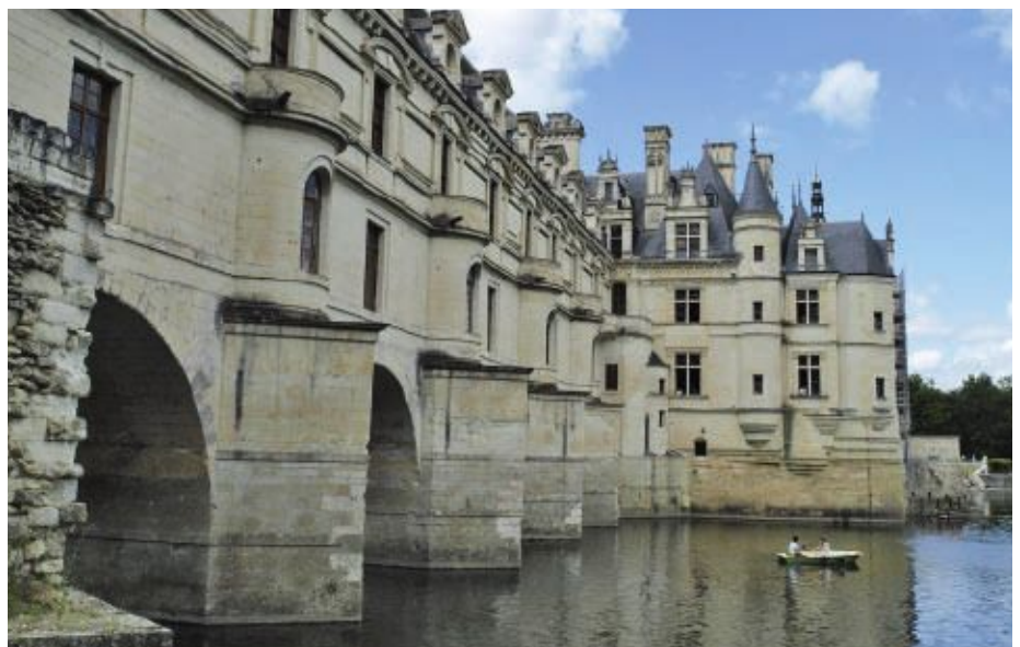
... et de Chenonceau.

La commune d'Amboise et la communauté de communes des Deux Rives ont par ailleurs initié une démarche de détermination des besoins du territoire, l'étude "Profusion". La dotation d'intercommunalité, même augmentée d'un million d'euros, ne permettra pas de couvrir les nouveaux projets et l'harmonisation des compétences. Celle-ci, d'ailleurs, diminuera avec le temps alors que les réalisations et leurs frais de fonctionnement seront pérennes. De plus, les orientations et les objectifs définis par le projet de territoire Profusion sont concentrés sur la ville centre principalement, et ne contribuent pas à équilibrer la répartition des équipements. Ils devraient prendre en compte un plus vaste territoire que le canton d'Amboise car des points intéressants sont abordés.