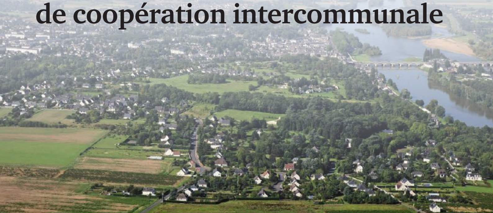
Une synergie positive entre ruralité et urbanisation.

Les communes membres de Val d'Amboise et les communautés de communes voisines ont toutes accueilli d'un vote défavorable le périmètre de coopération proposé par le Préfet. Extraits des délibérations.