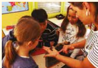
En classe de CMI/CM2 à Mosnes.

De la maternelle au collège, le programme pédagogique, adapté selon les niveaux, aborde en trois à cinq séances (une par semaine) le tri sélectif, le recyclage, le compostage, la fabrication de papier recyclé, le développement durable et le