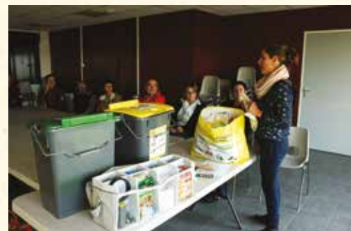
La plupart des agents de la ville de Nazelles-Négron ont suivi une formation à l'automne 2018.

Dans la formation adultes, qui se déroule sur une demi-journée, l'accent est mis sur le tri sélectif et le devenir des déchets. « Nous faisons le point sur les consignes de tri et apprenons à bien distinguer les plastiques et les papiers recyclables de ceux qui ne le sont pas. Ces deux grandes familles réservent de nombreux « pièges » aux adultes, poursuit la jeune femme. Je réponds également aux questions que les personnes se posent sur la deuxième vie des déchets