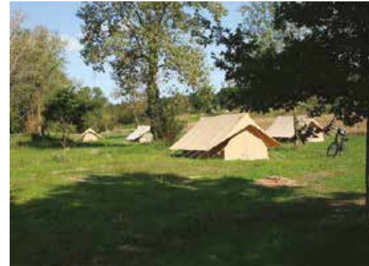
➤ Développer le tourisme vert et l'hébergement de plein air, comme ici à Chargé.

pectant les politiques nationales et en tenant compte des particularités du Val d'Amboise. » Parmi les quinze orientations et objectifs du PADD (lire ci-dessous), certains points font l'objet d'une attention particulière. Ainsi, le quartier de la gare d'Amboise devrait se transformer avec l'effacement des friches industrielles et des espaces délaissés pour y asseoir un pôle d'équipement publics et rapprocher les services des habitants. Le futur PLUi traduira également la volonté des élus d'associer très étroitement la planification territoriale au Plan climat de la CCVA (PCAET) : les nouvelles opérations d'aménagement affirmeront l'identité locale tout en se montrant exemplaires dans la conception bio-climatique. Les opérations groupées (10 logements et plus) permettront la gestion collective des déchets. Des mesures incitatives favoriseront le recours aux énergies vertes et l'autonomie énergétique, y compris dans les zones d'activités économiques qui offrent des opportunités pour développer une utilisation rationnelle de l'énergie