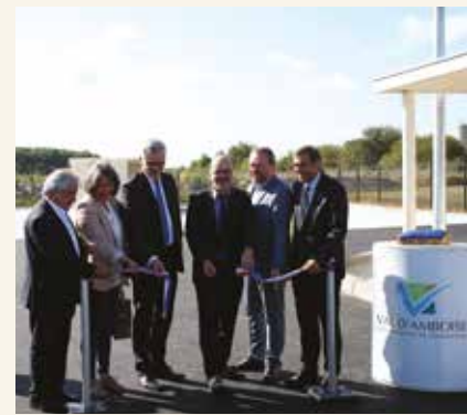
➤ Inauguration de l'aire d'accueil des gens du voyage, en août 2017.