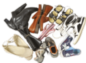
Baskets, bottes, tongs, chaussures, sandales...

! Relier les paires avec un élastique ou par les lacets