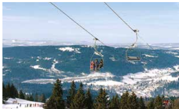
📍 La station offre une vue à 360° sur les massifs environnants.