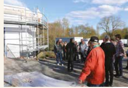
➔ Visite du chantier du centre socio culturel de Nazelles-Négron.

➔ Lancement du dispositif Conseil en énergie partagé (CEP) de l'ALEC 37, pour sensibiliser les élus locaux à l'éco-rénovation, aux énergies renouvelables et à la mise en œuvre d'une stratégie d'efficacité énergétique. 90 % des communes sont rencontrées et s'engagent quasiment toutes dans des projets.