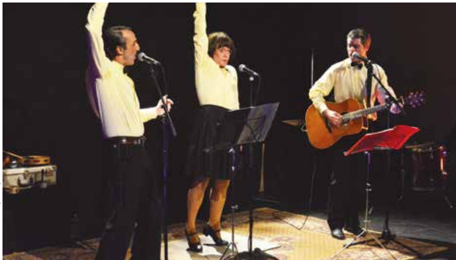
📍 Le trio Pierre, Paul et Paule a fait rire aux larmes le public de Montreuil-en-Touraine.

+ d'infos : www.cc-valdamboise.fr/sortir/culture/