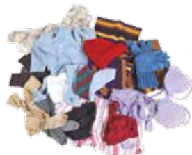
Bonnets, chaussettes, collants, cravates, foulards, écharpes, layette, lingerie...

! Propres et secs, inutile de les repasser