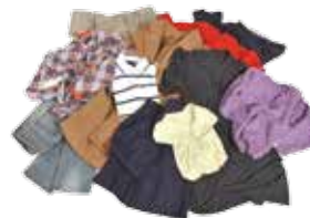
Chemises, jeans, joggings, jupes, manteaux, pulls, sweat-shirts, T-shirts...

! Propres et secs, inutile de les repasser