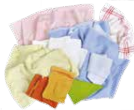
Draps, taies, serviettes, gants de toilette, torchons...