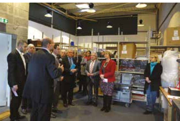
👉 Visite inaugurale, le 18 décembre 2013.

de la CCVA et les financeurs (Etat, Région, département) en présence de l'ensemble des acteurs locaux impliqués dans la création d'entreprise. De 2013 à 2018, Pep'it accompagne une vingtaine d'entreprises qui ont pour la plupart créé plusieurs emplois. Fin 2017, cinq entreprises arrivées à la fin de leur parcours résidentiel quittent la pépinière. Elles bénéficient d'un accompagnement pour intégrer le tissu économique local. En 2018, quatre nouvelles entreprises s'installent au sein de la Pep'it, pour une durée de 2 années.