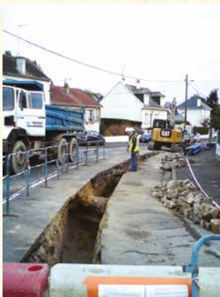
➔ Une enveloppe annuelle estimée à 750 000 € pour le renouvellement des réseaux.

retenus par la collectivité sont l'amélioration du suivi des performances, l'amélioration du fonctionnement hydraulique (avec la construction d'une usine de traitement du manganèse), la sécurisation de la production en eau potable et la préservation de la nappe du Cénomaniens et la gestion patrimoniale (qui passe notamment par le renouvellement des réseaux). Un programme de travaux adapté aux besoins de la collectivité et à ses moyens (techniques et bien sûr financiers, en lien avec le prix de l'eau) a été établi. Son montant global s'élève à 1,6 million d'euros qui seront investis à moyen terme pour améliorer le dispositif de suivi, les performances du fonctionnement hydraulique et la production d'eau potable.