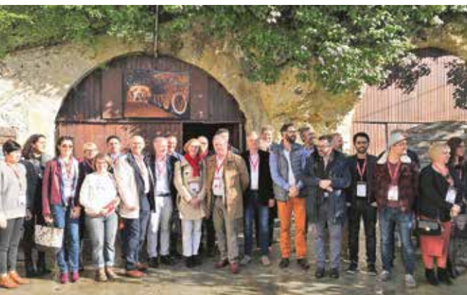
↳ Réunis par l'envie de faire rayonner la Touraine !

Plus d'info : pour devenir ambassadeur, rendez-vous sur https://toursloirevalley.eu/devenir-ambassadeur/