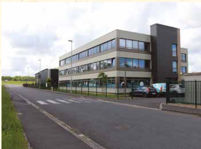
➔ Les nouveaux locaux du SMICTOM, à Nazelles-Négron.

Les collectivités concernées représentent une population d'environ 950 000 habitants. Quant à l'investissement nécessaire à la réalisation de ce centre de tri, il est de l'ordre de 26 millions d'euros (hors subventions).