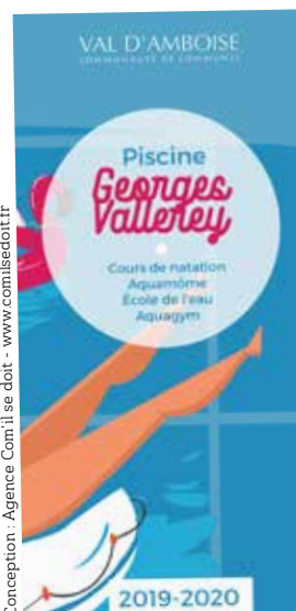
Conception : Agence Com'il se doit - www.comilseidoit.fr

+ d'infos : en juillet-août, contacter Val d'Amboise au 02 47 23 47 44. A partir du lundi 2 septembre, contacter la piscine Vallerey au 02 47 23 10 69 / piscine.georgesvallerey@cc-valdamboise.fr