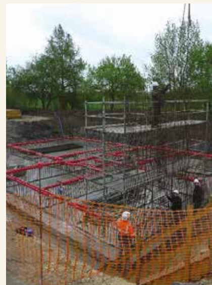
➔ La station d'épuration de Limeray en chantier.