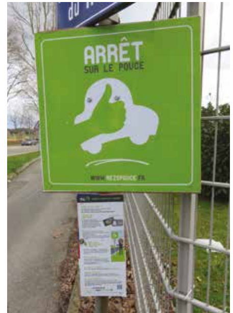
Le territoire sera maillé d'arrêts à la situation étudiée et clairement signalés.

Une enquête menée par le groupement des entreprises du Val d'Amboise en 2018 a mis en avant les problèmes de mobilité des actifs. Val d'Amboise souhaite donc proposer dans un second temps le déploiement de Rezo Pro aux entreprises du territoire. Cette solution de covoiturage domicile/travail vise à mettre en relation les salariés travaillant dans le même bassin d'activité pour offrir une solution de mobilité dans les zones mal desservies. Les entreprises doivent souscrire à Rezo Pro pour donner un accès gratuit à la plateforme à leurs salariés. Le site fonctionne ensuite comme une solution de covoiturage classique par la mise en relation conducteur/ passager, le partage des dépenses... et la baisse des émissions de CO2 ! ■