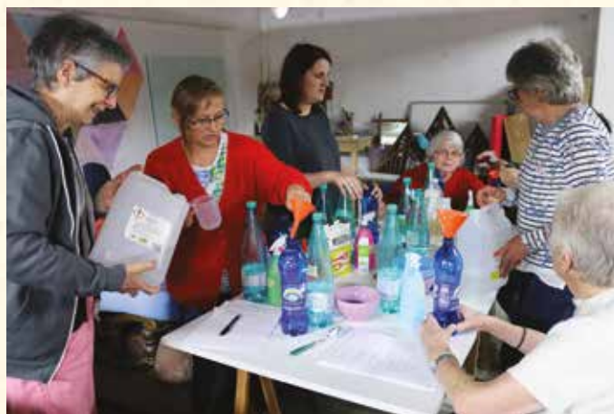
1 Fabriquer soi-même ses produits ménagers et d'hygiène écologiques.

Plus d'infos : Le programme et la vidéo « Paroles d'habitants » (réalisée à l'atelier) sont sur www.cc-valdamboise.fr/habiter/habitat-logement/amelioration-de-lhabitat/